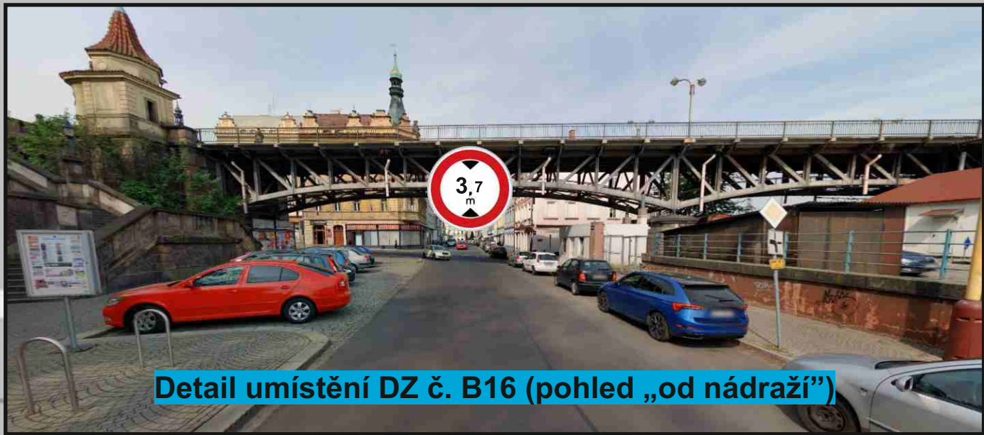
Detail umístění DZ č. B16 (pohled „od nádraží“)