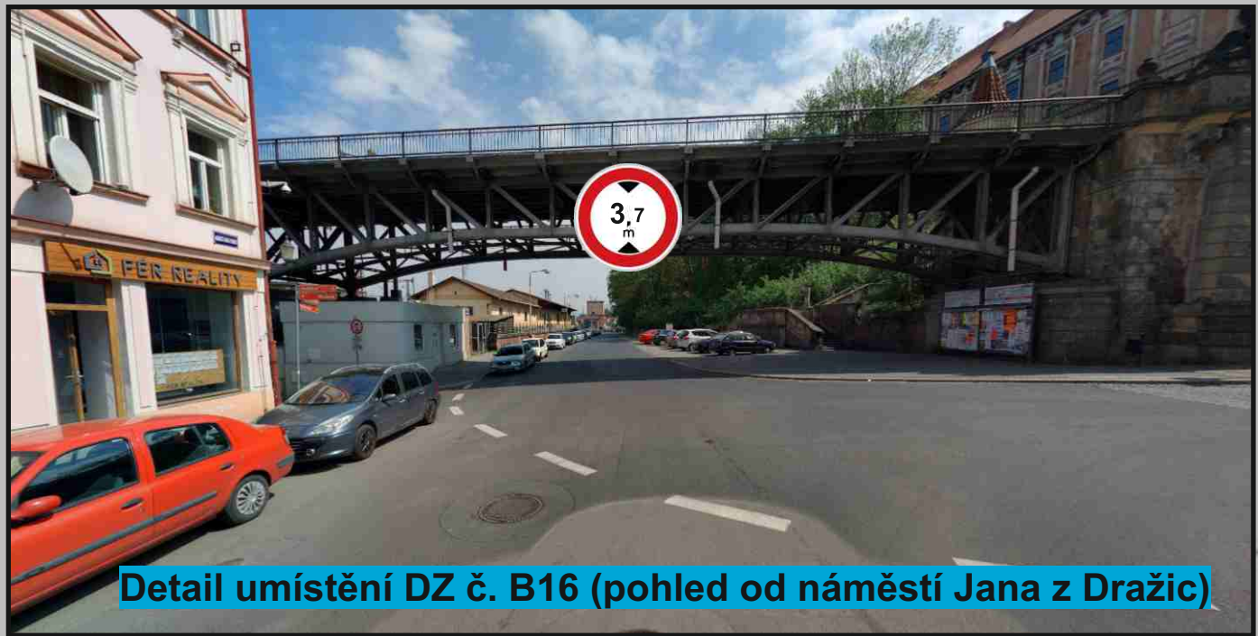
Detail umístění DZ č. B16 (pohled od náměstí Jana z Dražic)